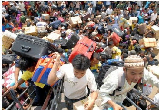
Gambar 1. Fenomena Urbanisasi

Pada umumnya, angka urbanisasi diperkirakan meningkat sebesar 3,5 persen setiap tahunnya. Berdasarkan angka yang dilansir Badan Pusat Statistik (BPS), pada tahun 2010 silam, diperkirakan angka urbanisasi yang terjadi sekitar 49,8 persen. Nilai ini meningkat di tahun-tahun selanjutnya, yaitu tahun 2015 yang mencapai angka 53,3 persen. Sedangkan di tahun 2016 ini, nilainya bertambah lagi menjadi 54,5 persen.